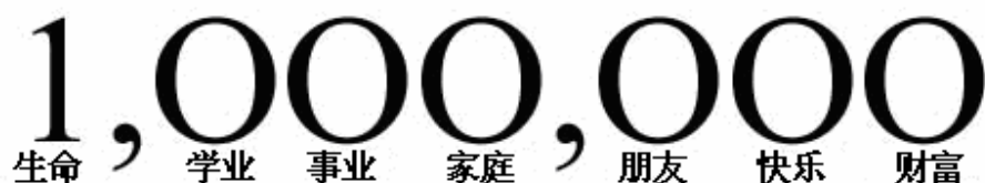
图1。没有生命就没有一切

人生来具有强壮的生命力。如果不出什么事的话，一般人都应能活到七、八十岁。但现实却不是像人自己所期望的那样美好。有些人如愿活到应得的年龄，而另一些人却因为各种内外界因素而过早地夭折了。这其中包括很多中小学生，他们的生命之花未来得及开放便凋零了。他们留给家人的是永远的伤痛，因为世界最悲哀的莫过于白发人送黑发人。尤其是在中国社会，因为大多数家庭都是独生子女。